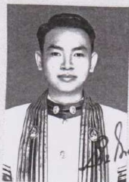
นายทะเบียนลงนามทำรูป

อธิการบดีมหาวิทยาลัยราชภัฏวไลยอลงกรณ์ ในพระบรมราชูปถัมภ์