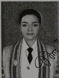
นายทะเบียนลงนามทับรูป